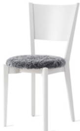
WOODY by Ruud Ekstrand