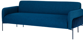
NOUVEAU! BOLERO by Nina Jobs