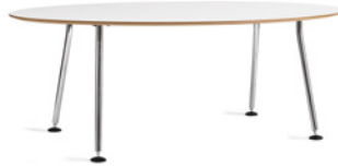
DISC by Ruud Ekstrand