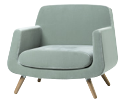
JEFFERSSON by Alexander Lervik