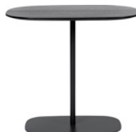
MATSUMOTO by Claesson Koivisto Rune