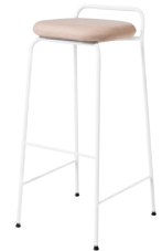
NOUVEAU! SOFT TOP by Brad Ascalon