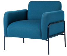
NOUVEAU! BOLERO by Nina Jobs