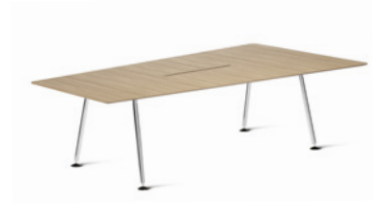
DISC XL by Ruud Ekstrand