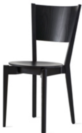
WOODY by Ruud Ekstrand