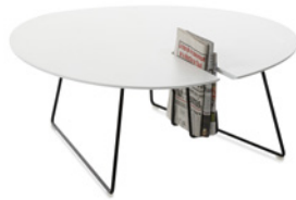
POND by Charlotte Elsner