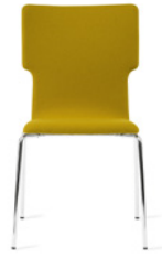
BOMBITO T by Jonas Lindvall