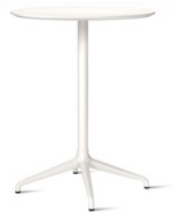
PRIMO by Stefan Borselius