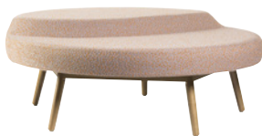
ISA by Louise Hederström