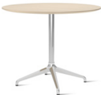
PRIMO by Stefan Borselius