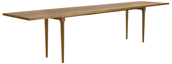
OAK by Jonas Lindvall