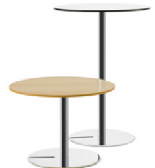
SLITZ by Mattias Ljunggren