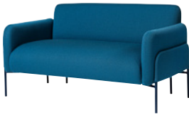
NOUVEAU! BOLERO by Nina Jobs