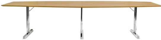
DISC UP by Ruud Ekstrand