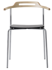
CORE by Mattias Ljunggren