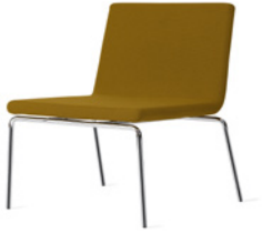
AFTERNOON by Claesson Koivisto Rune