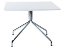
FLEX by Ruud Ekstrand