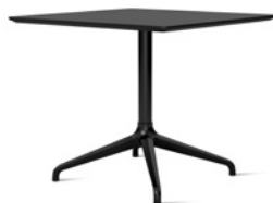
PRIMO by Stefan Borselius