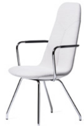
PRIMO by Stefan Borselius