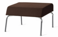
DROPP by Claesson Koivisto Rune