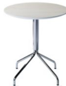
FLEX by Ruud Ekstrand