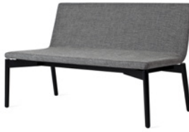
AFTERNOON by Claesson Koivisto Rune