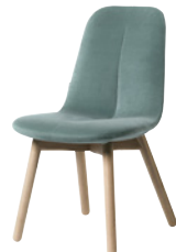
PRIMO by Stefan Borselius