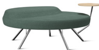
ISA by Louise Hederström