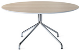
FLEX by Ruud Ekstrand