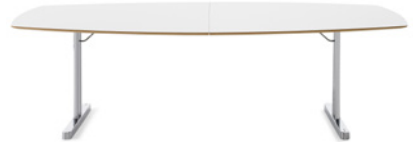
DISC UP by Ruud Ekstrand