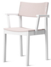
DECIBEL by Ruud Ekstrand