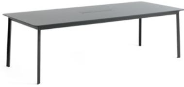
MODULOR by Claesson Koivisto Rune