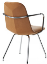
PRIMO by Stefan Borselius