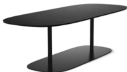
MATSUMOTO by Claesson Koivisto Rune