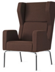
DROPP by Claesson Koivisto Rune