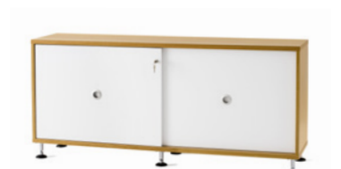
MOBYDISC by Ruud Ekstrand