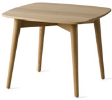
PAPA by Jonas Lindvall