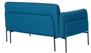
NOUVEAU! BOLERO by Nina Jobs