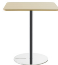
SLITZ by Mattias Ljunggren