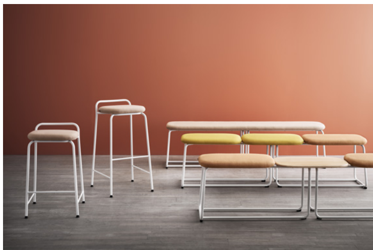
Soft Top by Brad Ascalon

Une nouvelle partie rectiligne offre encore plus de possibilités pour remodeler et étendre sans fin la colonne vertébrale ondulante. Avec ou sans dossier. Monochrome ou bigarré. Et désormais rectiligne ou ondulant. Avec le canapé à sections Spino, seule l'imagination fixe les limites. Au moins tant que la pièce le permet.