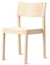
DECIBEL by Ruud Ekstrand