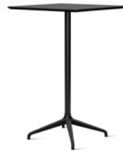
PRIMO by Stefan Borselius