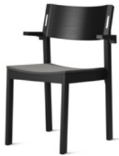
DECIBEL by Ruud Ekstrand