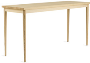
OAK by Jonas Lindvall